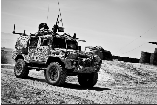
Personterrängbil 6, "Galten"