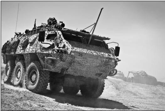
Pansarterrängbil 203 A, Patria